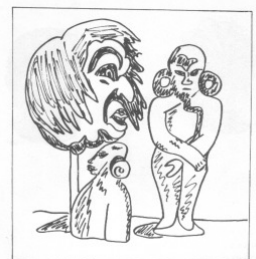
Victor Tushom, „Exotische Masken und Figuren“, 1923